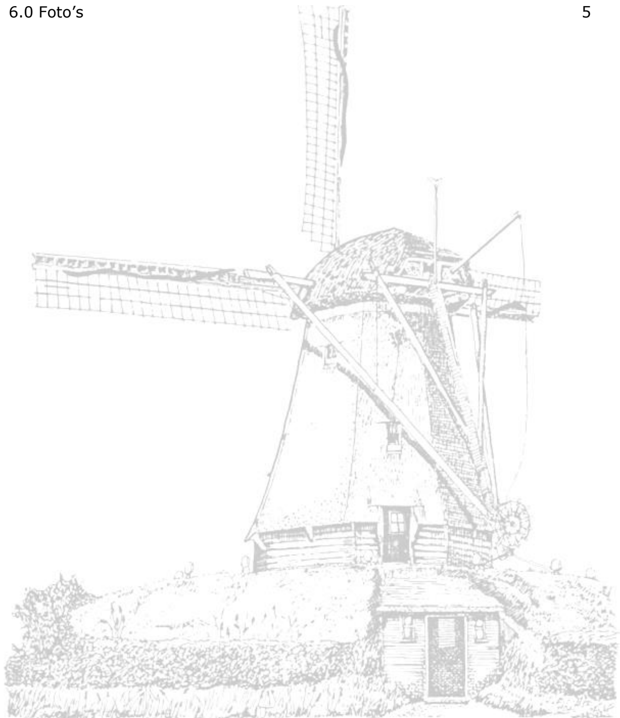
Molen „De Duif“ Nunspeet